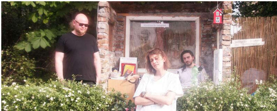
Drei Künstlerinnen und Künstler des Kollektivs "LA54" vor dem Backsteinhaus.

Ein Gebäude in Friedrichshain steht seit mehr als sieben Jahren leer. Nun sollen Büros für Start-Ups entstehen. Auch zehn Prozent für die Kunst? VON ROBERT KLAGES